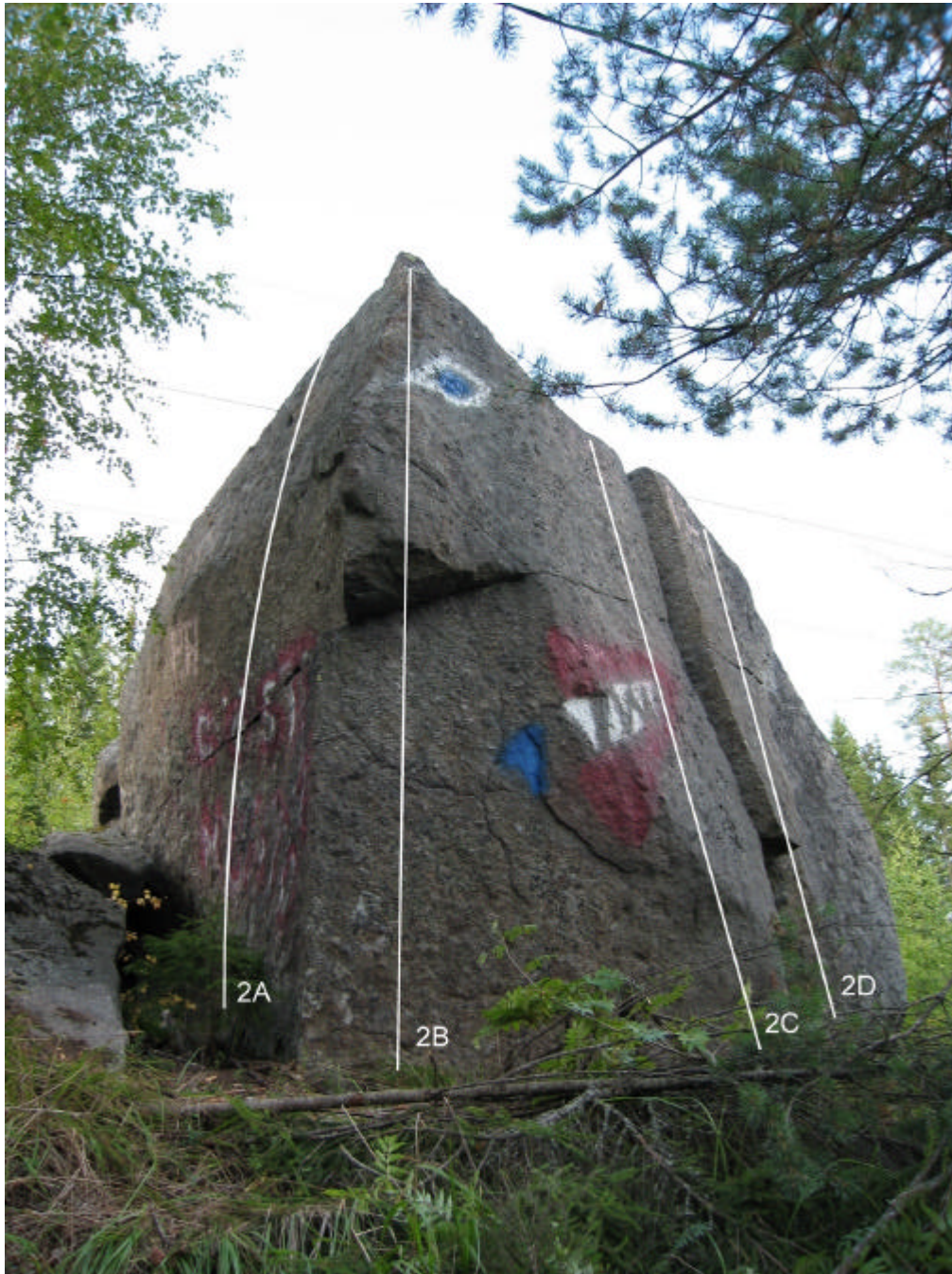
2A. Nippulat (6a) 2B. Nenämakeinen (5+)