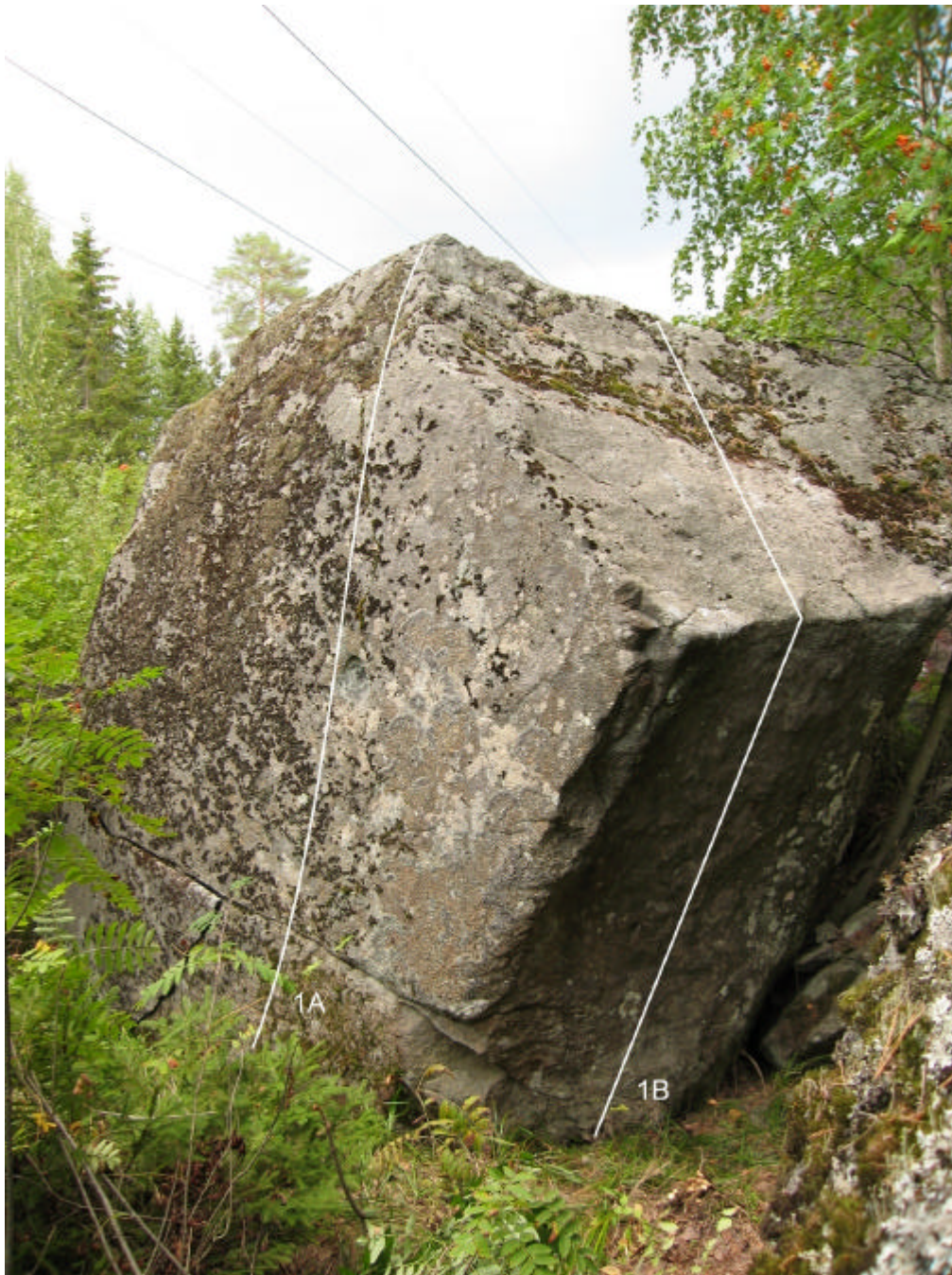
1A. Luomu (6a) 1B. Nysä (6a+, ilman vasenta kanttia)