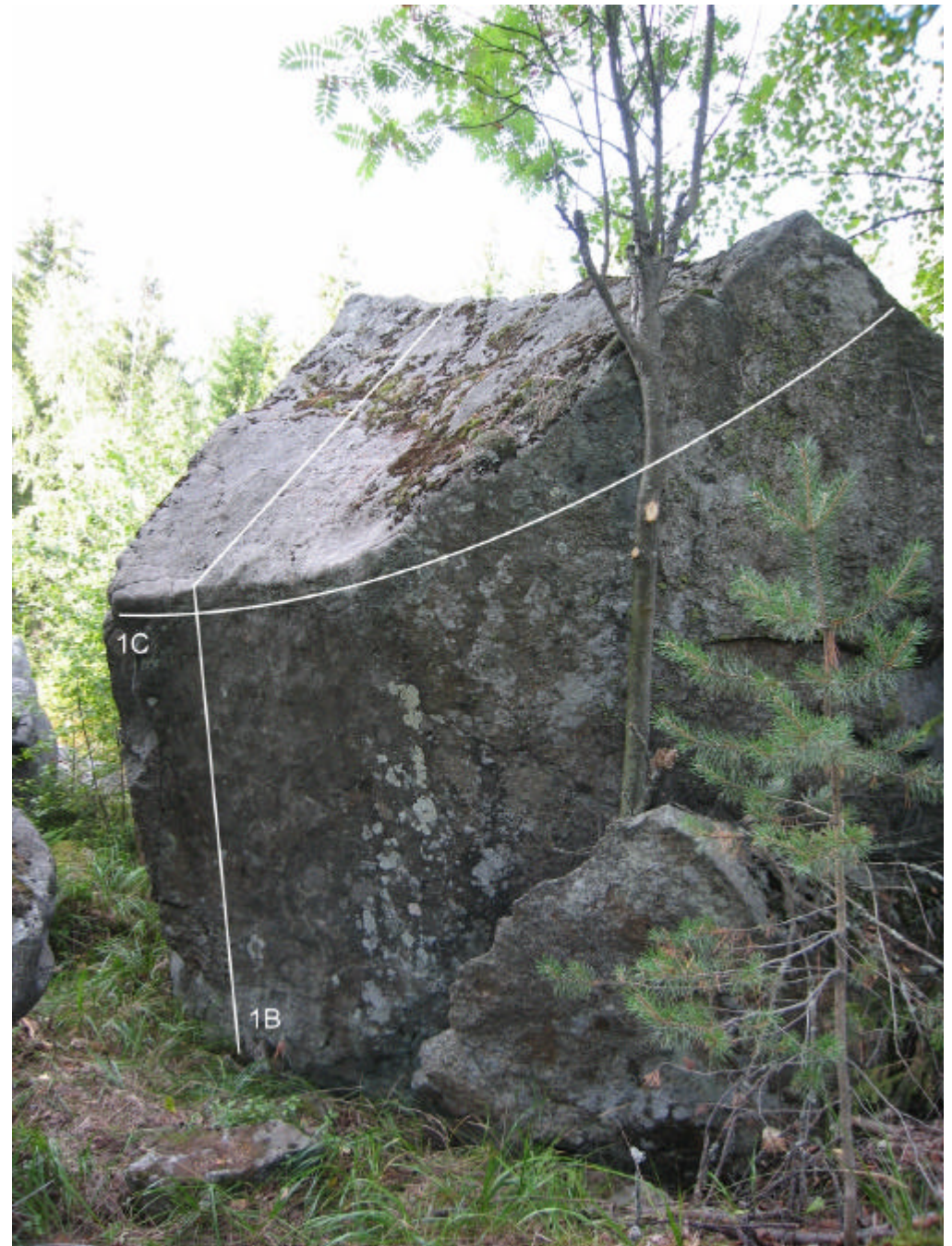
1C. Napakarkki (6a+)