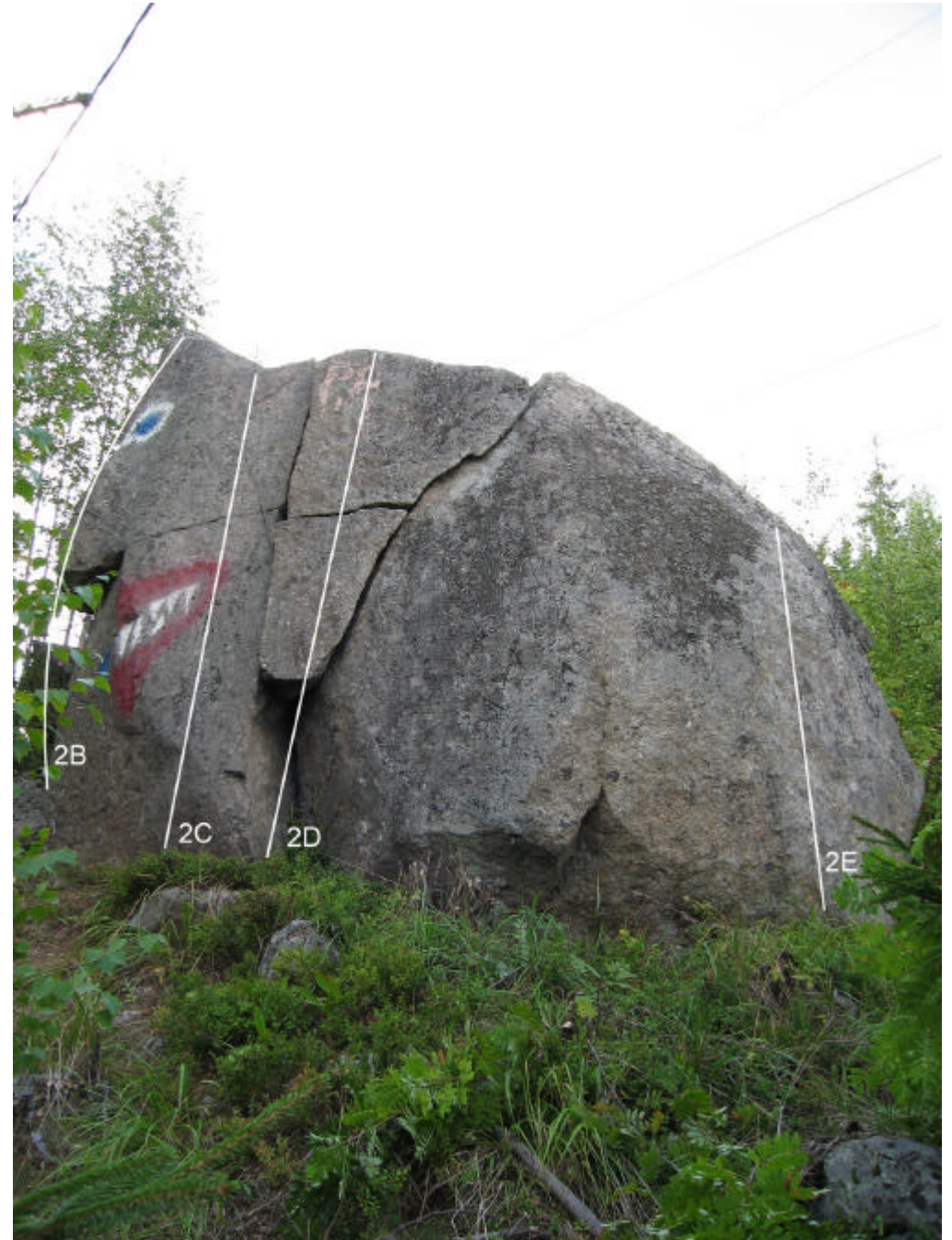
2C. Näppylät (6a) 2D. nimetön (4+) 2E. Polvi (6c)